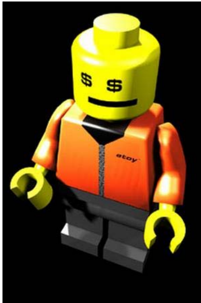
Slika 6.4.: Spletni vojaki v Toywar

Vir: http://www.debalie.nl/viewimage.jsp?imageid=13944 , 27.06.2006