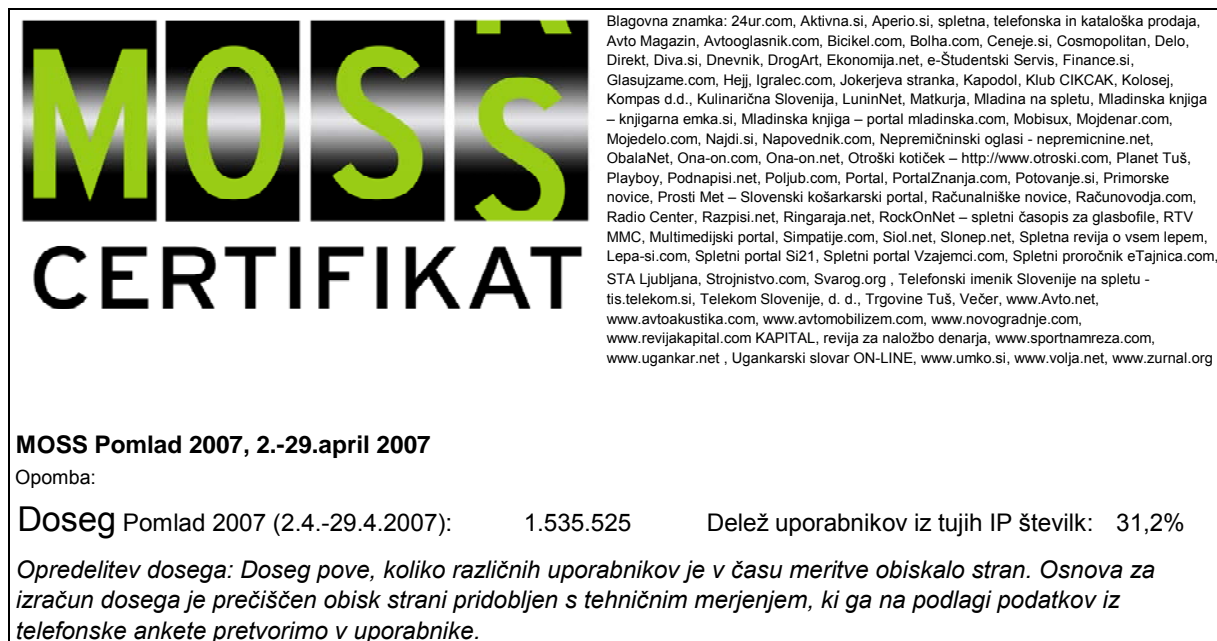
Slika 2: Certifikat – doseg, delež uporabnikov iz tujih IP števil

Doseg vseh 82 merjenih strani znaša 1,5 milijona obiskovalcev. Med njimi je 31% obiskovalcev lociranih izven Slovenije.